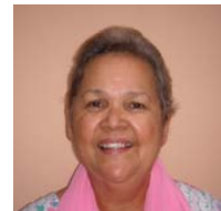
Rose Keanu Reeves ss.cc.

Nuestros hermanos Sagrados Corazones han servido fielmente al pueblo de Dios en India, en las diócesis de Orissa y Kolkata, durante los últimos 30 años. La población católica es de un 2% en India. El resto de la gente practica el Hinduismo, Islam, Budismo y otras religiones menores. Aunque la población católica es sólo el 2%, el total de católicos es significativo, pues la población en India es superior al billón de personas. Obviamente esto supone un gran reto para nuestros hermanos Sagrados Corazones que quieren ejercer su ministerio en un mundo no-cristiano.