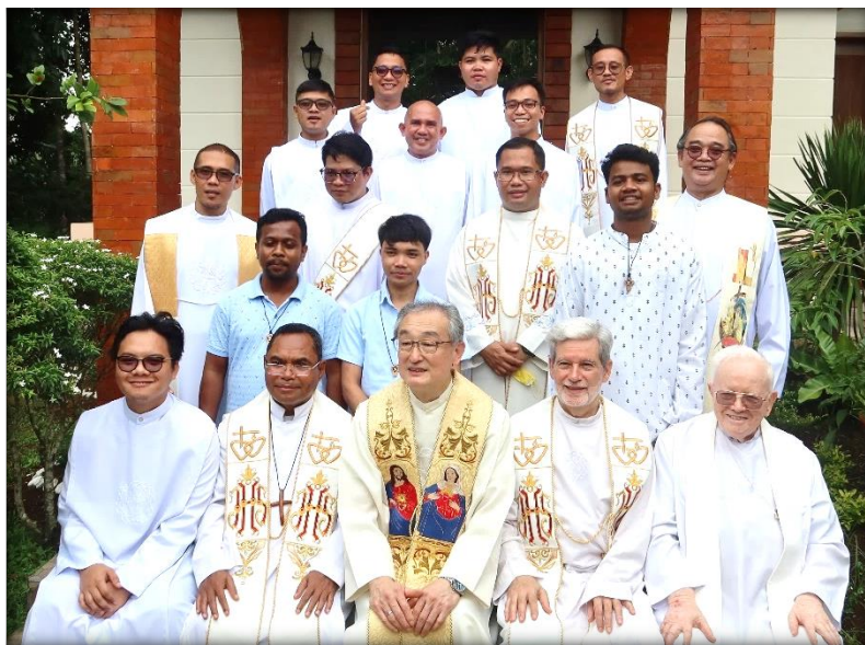
Comunidad en Filipinas (2023)