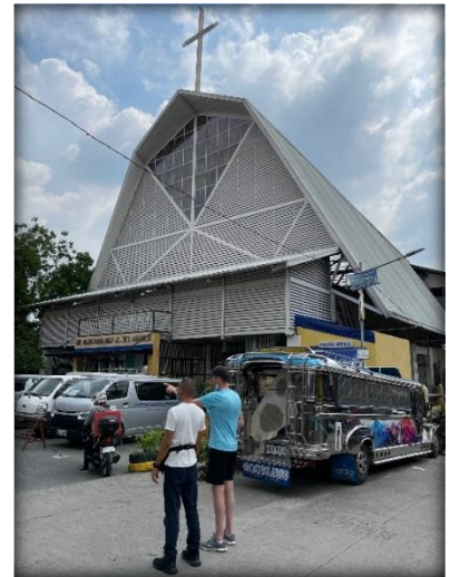
Bagong Silang Filipinas