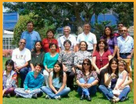
Communauté Padre Eustaquio, Lima Pérou

Après quelques mois de réunions très fréquentes, la communauté a un peu baissé sa fréquence. Actuellement, ils se réunissent une fois par mois, toujours virtuellement. Bien entendu, ils continuent à travailler avec une grande constance sur les thèmes qui ont été proposés et programmés en début d'année. Lors de leur dernière rencontre, ils ont travaillé sur la question de la mort : quelle est la vision chrétienne de celle-ci, les différentes manières de la traiter lorsqu'elle arrive à un proche, l'importance de se préparer à ce moment. Le mois prochain, ils auront leur réunion de Noël avec la communauté Miséricorde en Action.