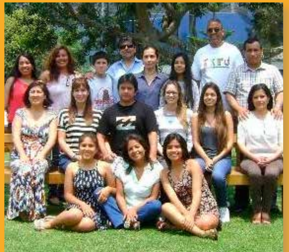
Communauté Misericordia en Acción, Lima Pérou