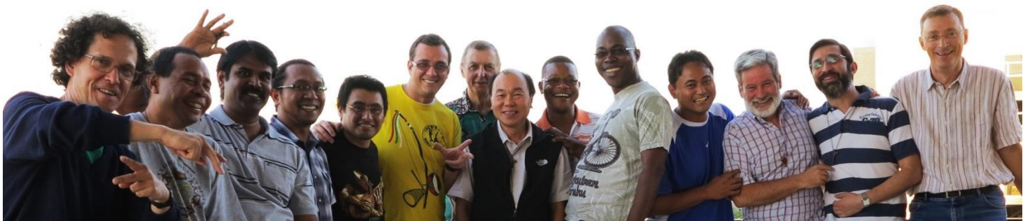
Casa General el 29 de septiembre de 2014